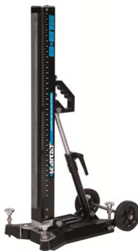
Bohrständer Large Bâti de forage