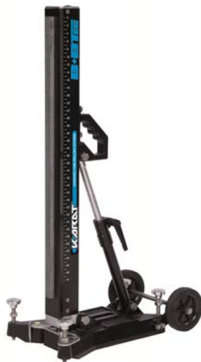
Bohrständer Large Support de perçage