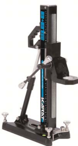
Bohrständer Compact Bâti de forage