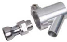
Trockenbohr-Set 1 ¼" oder GT Set pour forage à sec