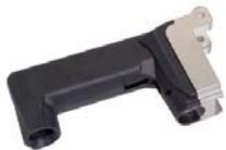
Zusatzhandgriff Poignée supplémentaire