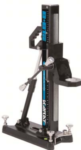
Bohrständer Compact Bâti de forage