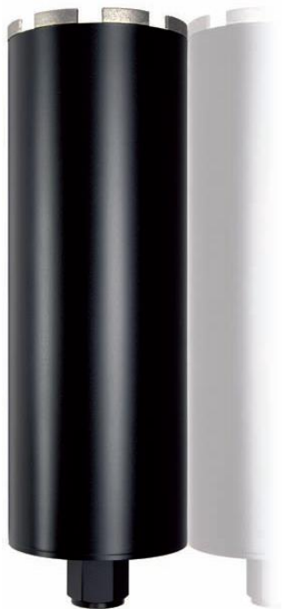
Anschluss raccord GT und 1 ¼"

EZSpeed 9 mm Beton, béton , HiSpeed 10 mm Standardnutzlänge Longueur utile standard 400 mm Anschluss raccord GT; 1 ¼"