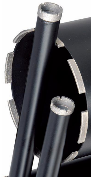
Anschluss raccord GT und ½ "