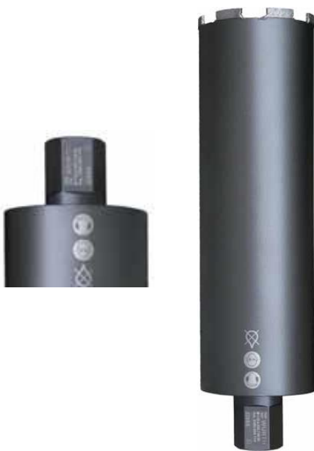
Anschluss raccord 1 1/4"

DrySpeed 9 mm Premium-Diamant-Trockenbohrkrone mit sehr hoher Bohrgeschwindigkeit und sehr hoher Standzeit Couronnes de forage diamant à sec Premium avec très haute vitesse de forage et très haute durée Ziegel, Backstein, Kalksandstein, Porenbeton, Betonsteine Tuiles, Brique, Grès, Béton cellulaire, Pavé,